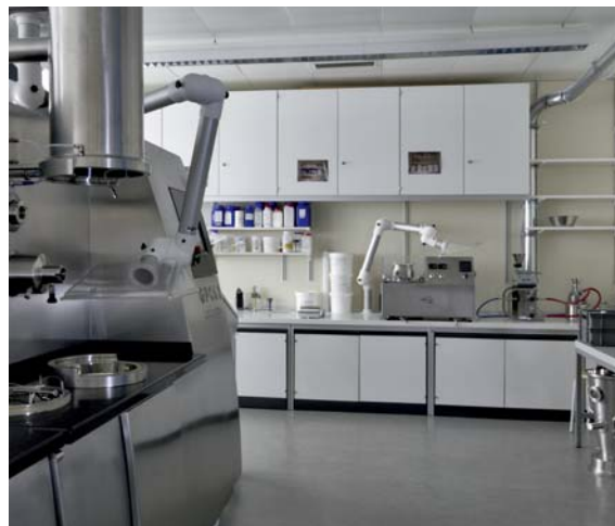
Lernfabrik Basel: Trainingsbereich für Anwendungen in der Prozessindustrie