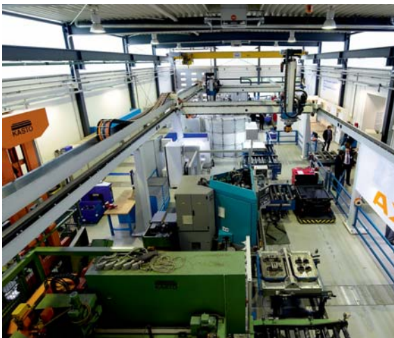
Lernfabrik Aachen: Trainingsbereich für Anwendungen in der Produktion

Wesentliche Bausteine für die anwendungsorientierte Vermittlung von Lean Methoden sind die beiden Lernfabriken in Aachen und Basel. Unsere Trainer/innen sind erfahrene Praktiker. In den Lernfabriken können Teilnehmer der Veranstal-